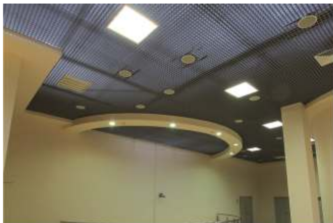
Светильник для внутреннего освещения общественных помещений.